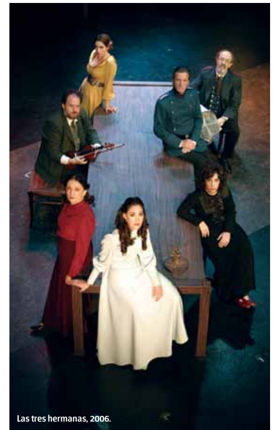
Las tres hermanas, 2006.

Es recomendable encontrar y crear un método para saber abordar el Texto teatral y recortar los elementos que