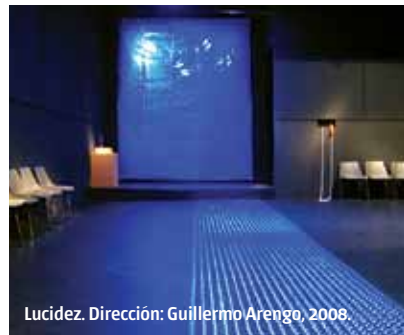
Lucidez. Dirección: Guillermo Arengo, 2008.

«un vestuario que 'no terminó siendo lo que habíamos pensado' se vuelve, dentro de la multiplicidad de lenguajes escénicos, una voz bajita y disonante, (...) y en el mejor de los casos, solo pasa desapercibido»