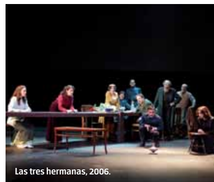
Las tres hermanas, 2006.