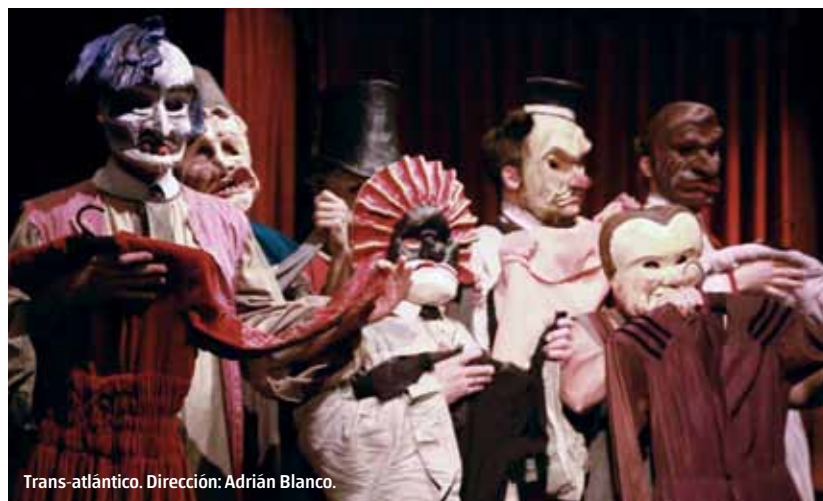
Trans-atlántico. Dirección: Adrián Blanco.

Las producciones independientes cuentan con sistemas de producción acordes al dinero que se tiene. Es hacer magia, pero es posible, sin bajar el nivel de creatividad ni el estético. A todas las