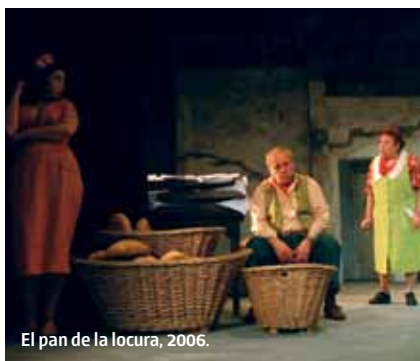
El pan de la locura, 2006.