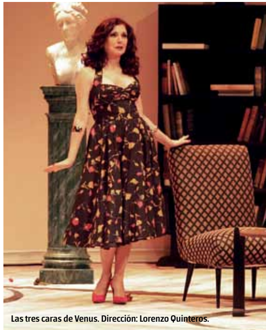
Las tres caras de Venus. Dirección: Lorenzo Quinteros.

propuestas sean más ricas o más pobres en la producción, les cabe el mismo compromiso. En general, se trabaja durante el proceso de ensayos.