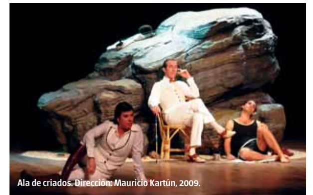
Ala de criados. Dirección: Mauricio Kartún, 2009.

En muchas ocasiones he deliberado sobre qué lugar ocupa el vestuario en una obra, de alguna manera eso era pensar también que lugar tiene mi voz. Que libertad tengo para crear.