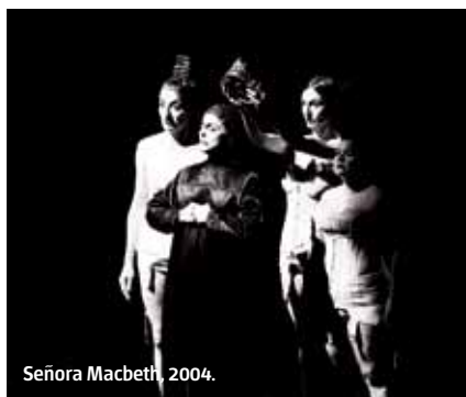
Señora Macbeth, 2004.

El indumento teatral es entonces, otra manera más de delimitar, de darle forma a la poética de un personaje, a un cuerpo actoral, en un espacio de ficción, bajo el pulso de un demiurgo. Puesto que todo ya ha sido hecho y nada nos pertenece, vestir es recrear. Partimos de una premisa y la herramienta que selecciona el material, es nuestra tijerita creativa, que es personal y única. Recortamos desde el depósito universal de poética emotiva para despertar la forma y recordarnos una vez más.