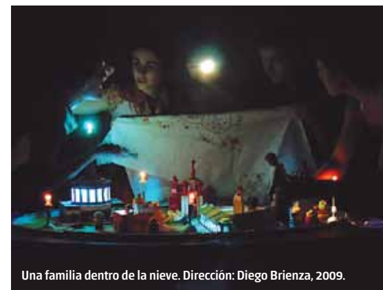
Una familia dentro de la nieve. Dirección: Diego Brienza, 2009.

«...la ignorancia de ciertos códigos vestimentarios nos haría aparecer desfasados, incómodos o ridículos, generando efectos adversos, ya que son construcciones sociales muy estrictas aunque no lo parezcan»