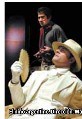
El niño argentino. Dirección: Mauricio Kartún, 2006.

Me sucedió algunas veces, dos o tres semanas después de hablar con el director llevar ideas, bocetos para mostrar lo que había pensando, y al ver el ensayo reírme de lo que ha cambiado el trabajo. Vuelvo a empezar, a pensar. Pero sigo de cerca lo que el equipo hace en la cancha, sino corro el riesgo de no ver el gol y perderme el festejo.