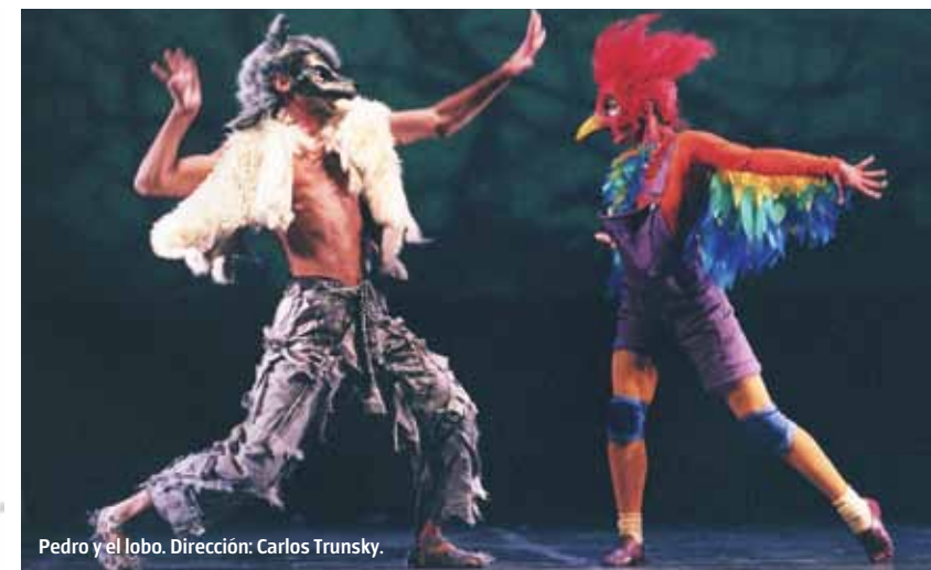
Pedro y el lobo. Dirección: Carlos Trunsky.

tic, porque no le alcanza el dinero para uno nuevo o porque sí. Para que sea bueno tiene que ser verosímil; si no es así, esa indumentaria estará enferma.