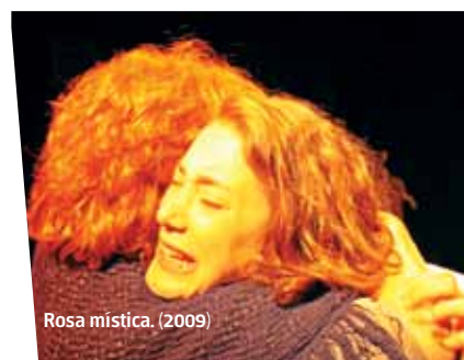
Rosa mística. (2009)