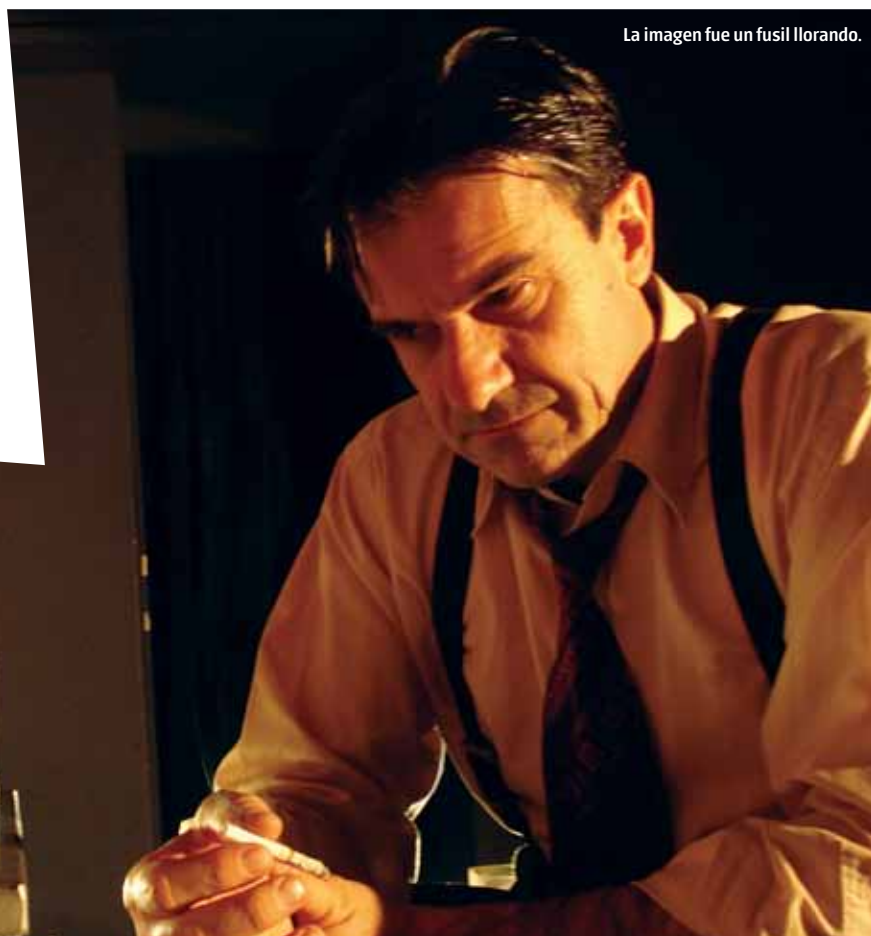
La imagen fue un fusil llorando.