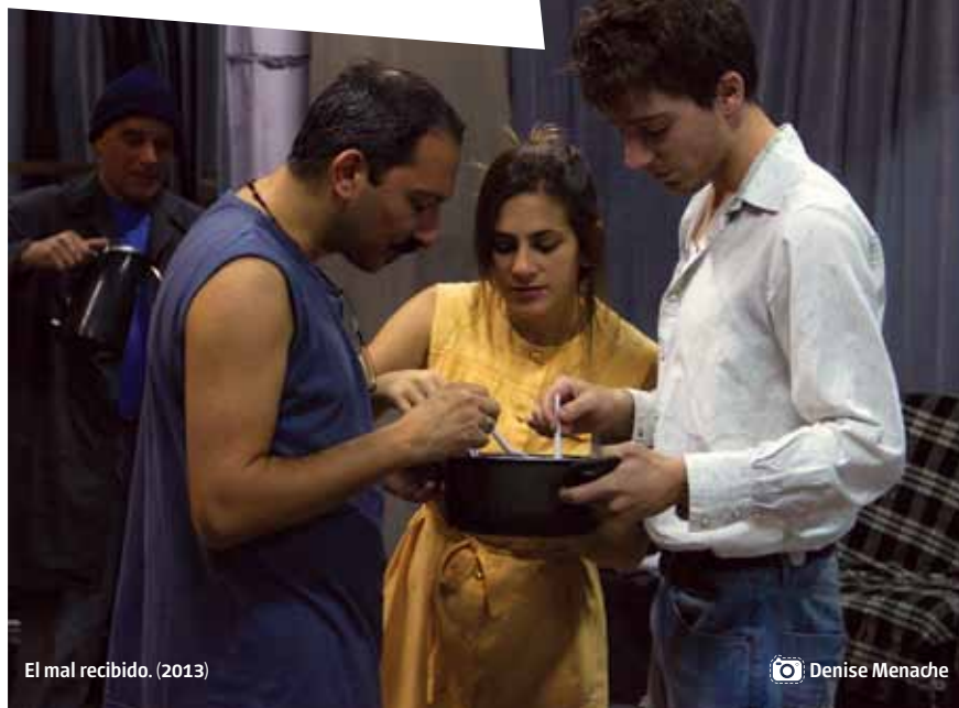
El mal recibido. (2013)